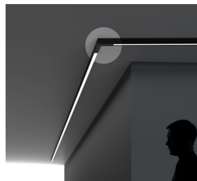
Mirò plafone giunzione angolare designed by TI Lighting LAB

Modulo a plafone giunzione angolare, lunghezza 16,8x16,8cm. Modulo non luminoso.