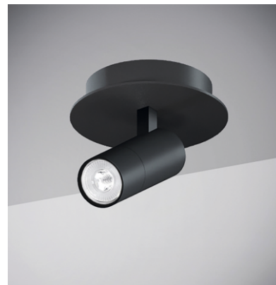
Tablet Round plafone 1 proiettore designed by TI Lighting LAB

Lampada a plafone con base di dimensioni Ø11cm H4cm, con proiettore orientabile Ø5,5cm H12cm. Emissione luminosa DOWN orientabile.