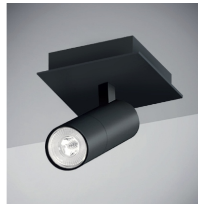
Tablet Square plafone 1 proiettore designed by TI Lighting LAB

Dimensioni: L11x11cm H4cm - Proiettore Ø5,5cm H12cm Temperatura operativa: -10 / +35°C Materiali: struttura: metallo diffusore: GU10 (sorgente non inclusa) Peso: 1kg